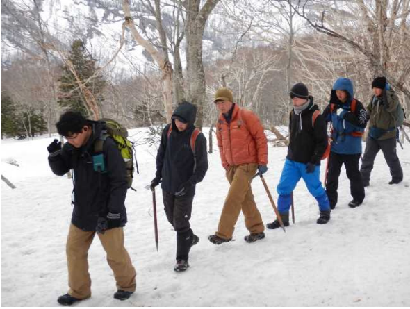
R5 (2023) 春季大会 登山行動の様子