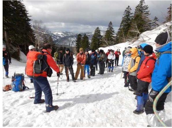
R5 (2023) 春季大会 雪上訓練の様子