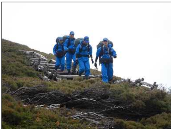
令和6年度 青森県高総体登山大会（6月）