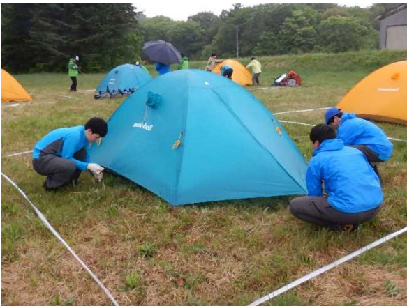
R5(2023) 高校総体 テント設営審査

第14回全国選抜スポーツクライミング選手権大会 (令和5年12月23日~24日) 埼玉県加須市