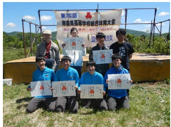
R5(2023) 高校総体 八工高集合写真