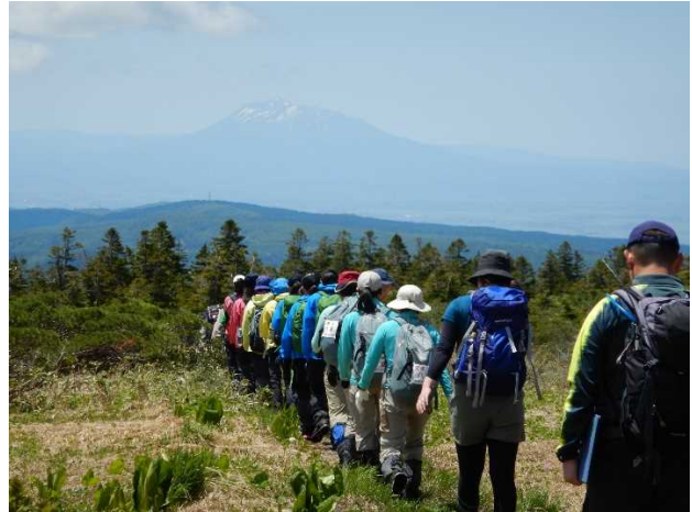
R3 (2021) 高総体 八甲田毛無岱(背景に岩木山)