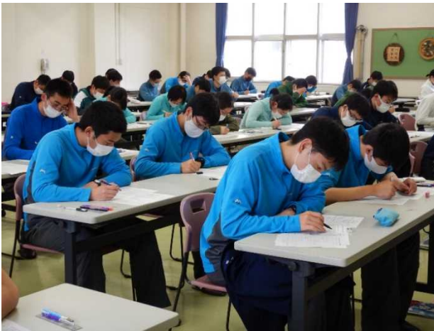
R3 (2021) 高校総体 筆記試験