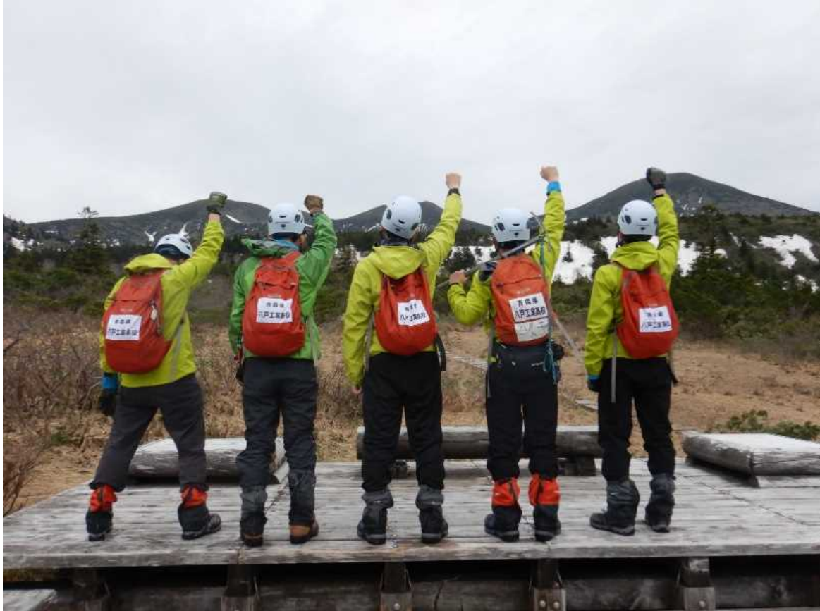
北八甲田 毛無岱湿原にて（R7、5月下旬）