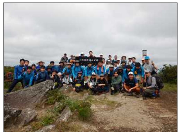
令和6年度 青森県高校秋季登山大会（9月）